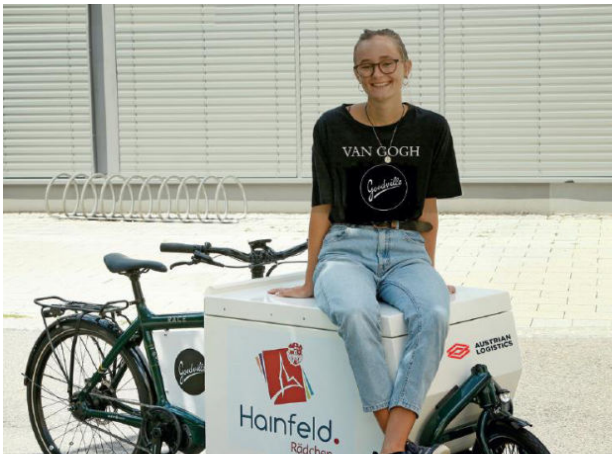
Abbildung 1: Vorbildprojekt „Hainfeldrädchen“ (NÖ) von Goodville, 2022

Die Besorgungsvolumina sind nicht groß und bei einer logistischen Kombination von individuellen Bedürfnissen und fixen Angeboten (wie z.B. Altglassammlung oder Bauernmarkt an bestimmtem Wochentag) können die Fahrten effizient gestaltet werden. Das Angebot sollte für bedürftige Zielgruppen kostenlos sein, für andere Personen kann eine Tarifstruktur pro Fahrt, Ziel oder auf Distanz kalkuliert werden. Auch die soziale Funktion des „kurzen Tratscherls“ stellt einen Wert dar.