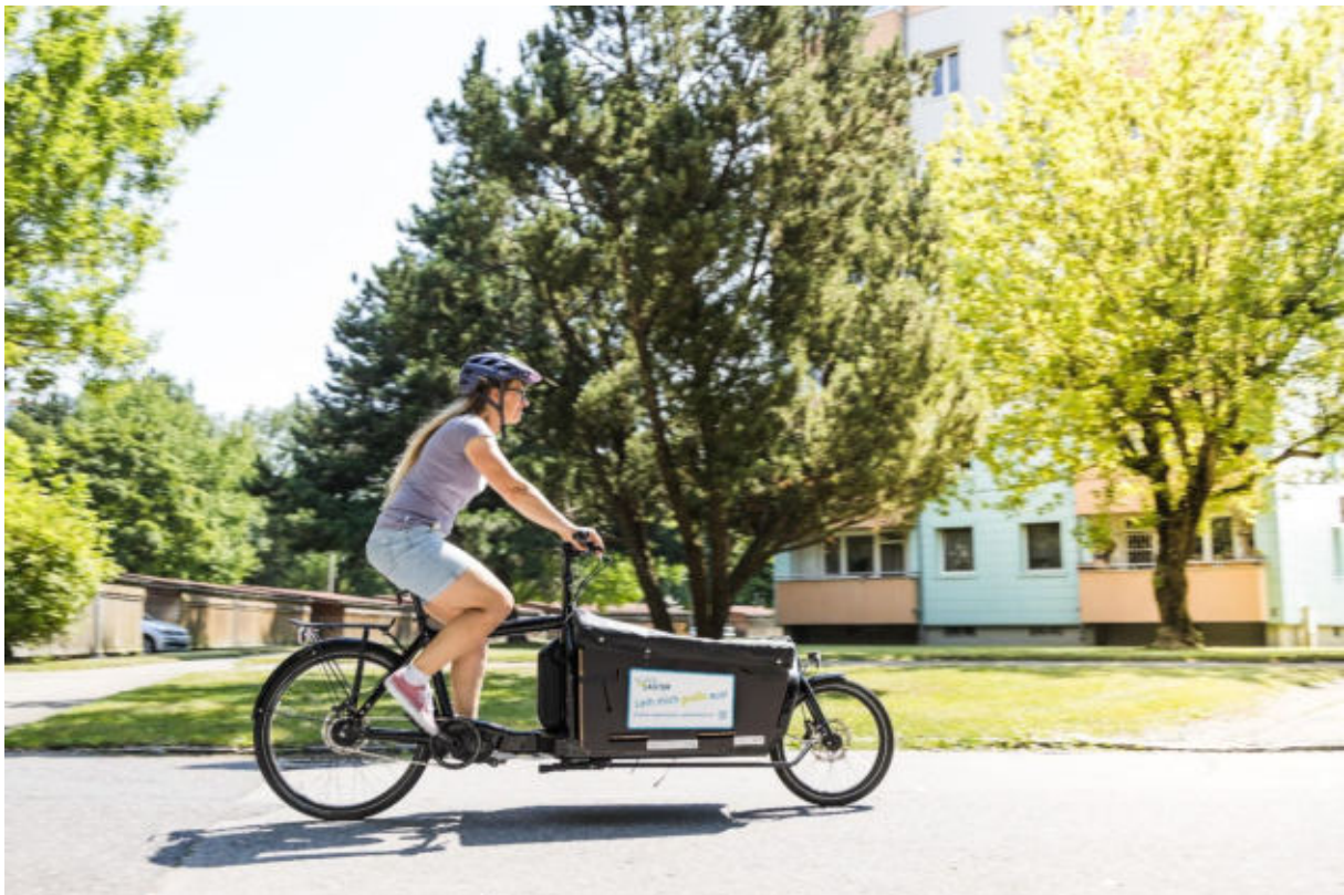
Abbildung 1: Abnehmerin für 3 Monate im Rahmen des Projektes HAUSRAD

Als Abonnent:innen eignen sich insbesondere Familien mit Kindern sowie generell Personen, die an Transporträdern interessiert sind und testen wollen, ob sich Transporträder gut in ihren Alltag integrieren lassen. Auch für Betriebe kann ein Abonnement eine ansprechende Möglichkeit sein, Transporträder als Dienstfahrzeuge einzusetzen.