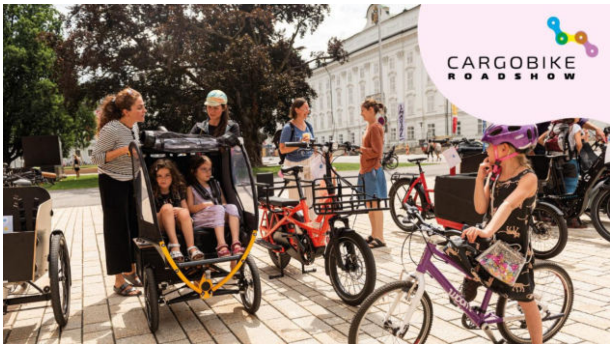
Die Cargobike Roadshow im Jahr 2021 in Innsbruck

Ein ausgebildeter Radfahrlehrer war zu diesem Zweck mit dem Sharing-Transportrad auf den Kinderspielflächen der Siedlung unterwegs,